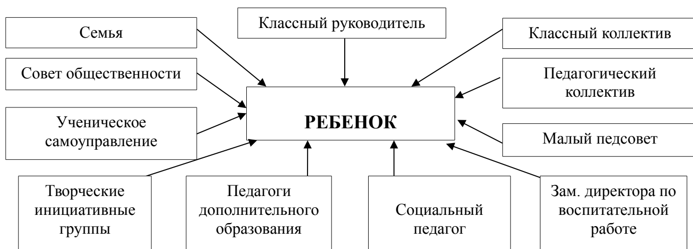
Схема педагогического воздействия на ребенка:

Важнейшей составляющей педагогического процесса является личностно ориентированное воспитание, при котором происходит развитие и саморазвитие личностных качеств школьников, становление ученика как личности с учетом индивидуальных особенностей.